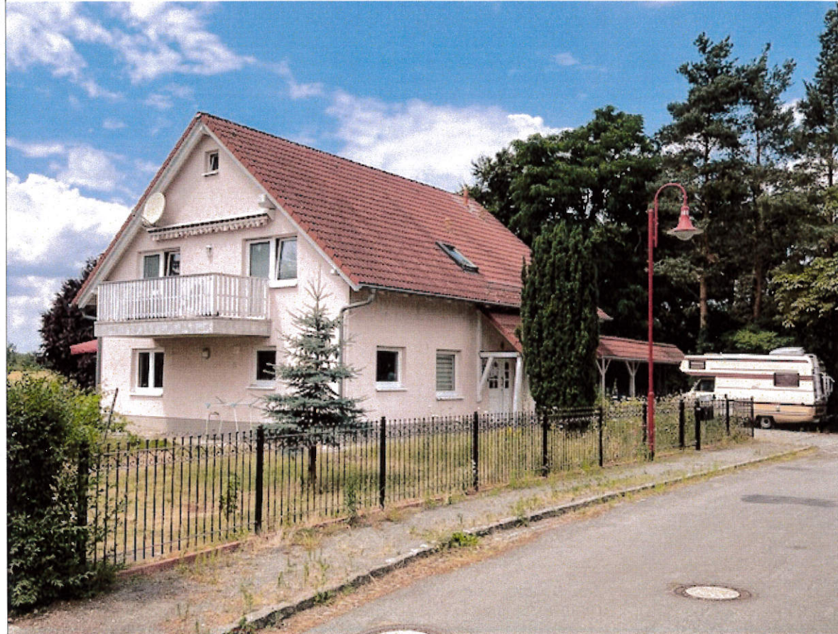
Robert-Bothe-Str. Nr. 11