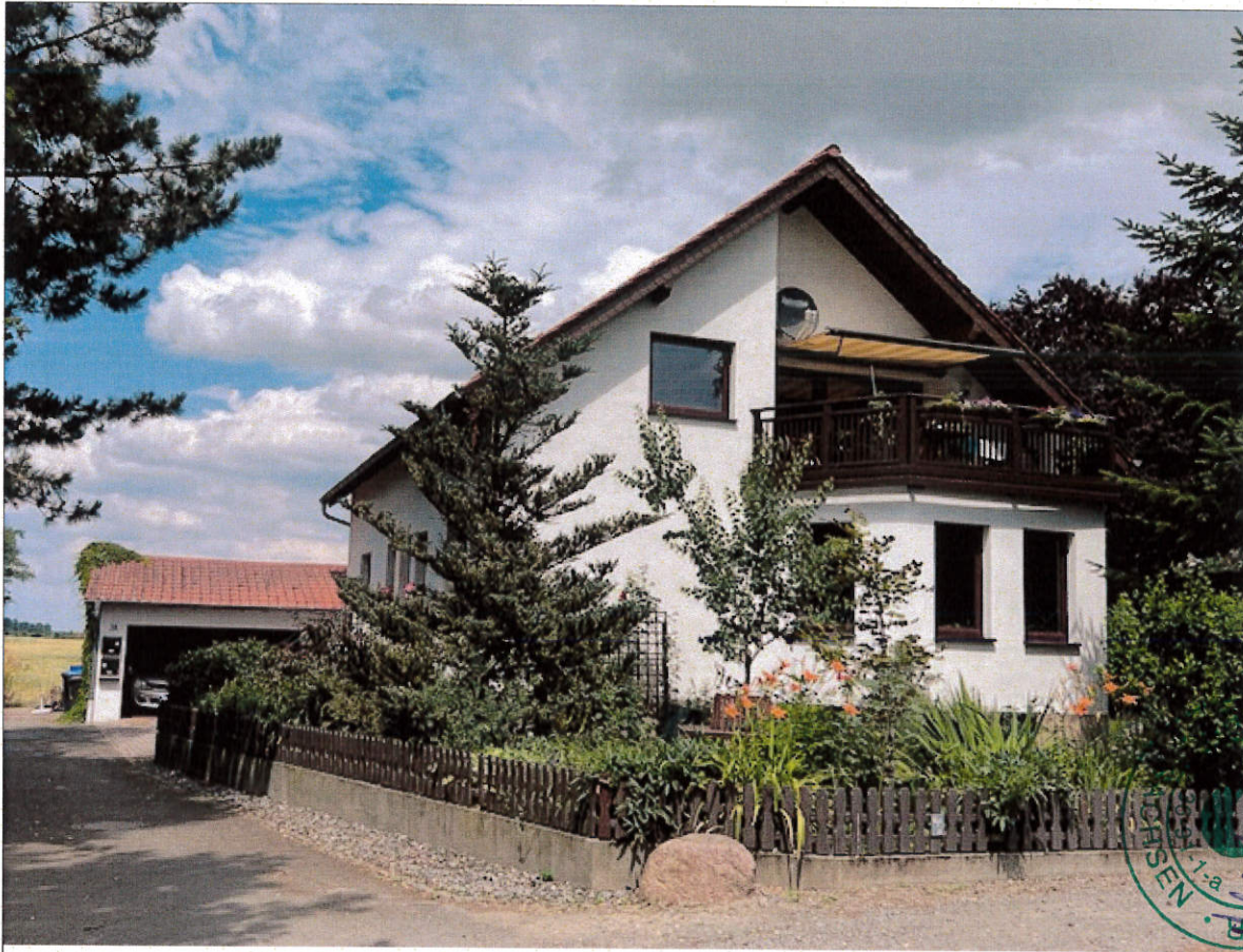
Robert-Bothe-Str. Nr. 16