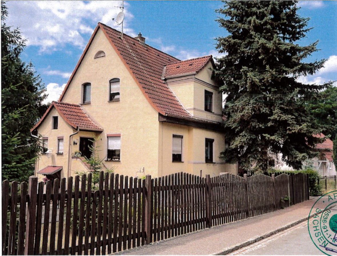
Robert-Bothe-Str. Nr. 9