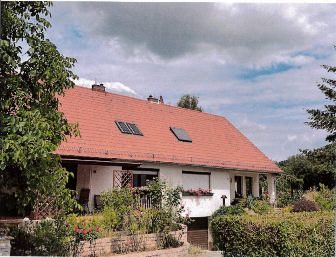
Robert-Bothe-Str. Nr. 18 / 20