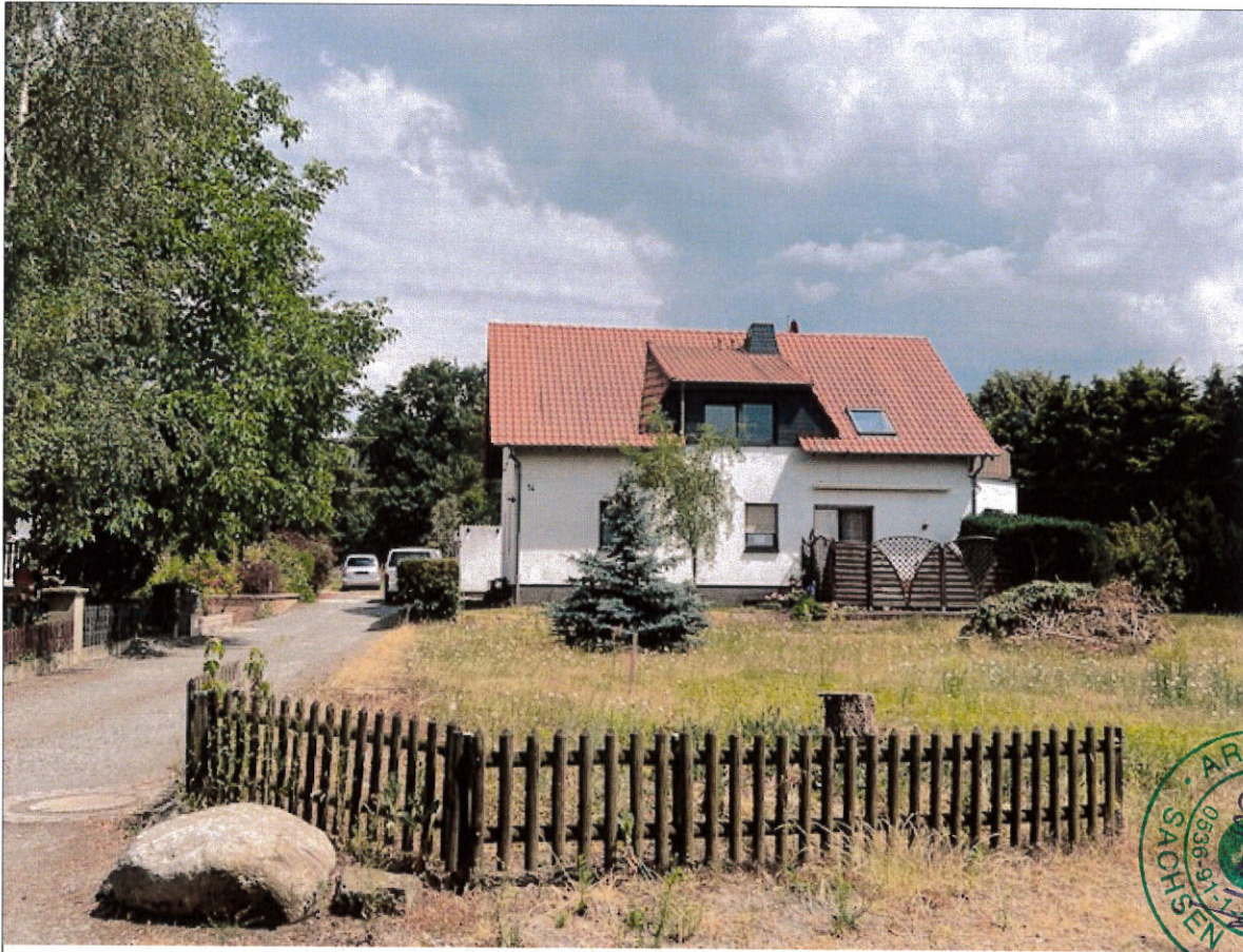
Robert-Bothe-Str. Nr. 14