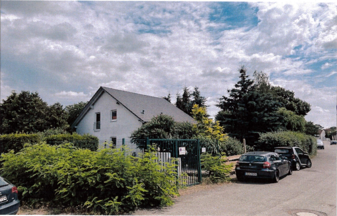
Robert-Bothe-Str. Nr. 10a