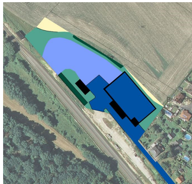
Abb.: vorhandene Bodeninanspruchnahme: