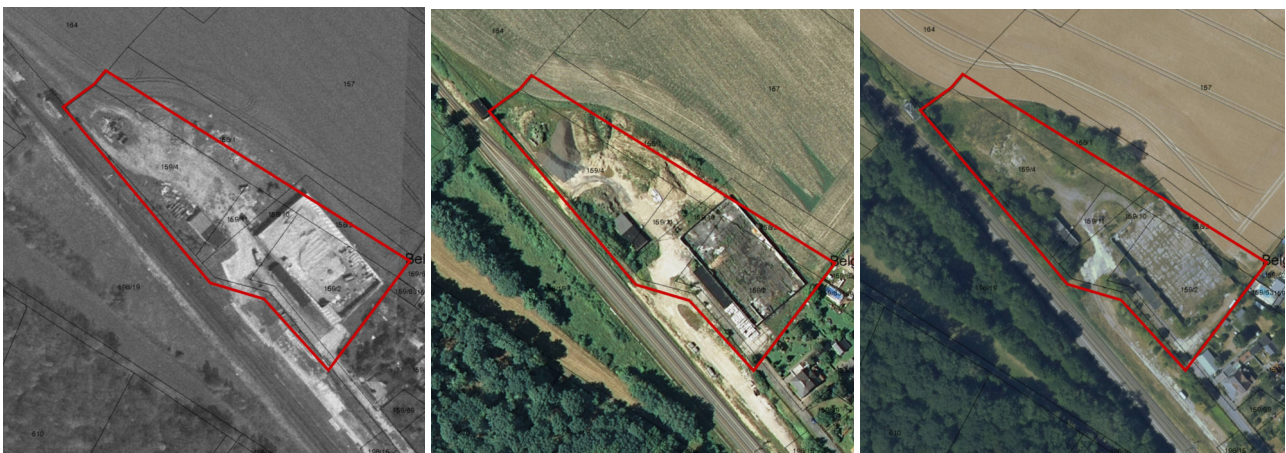
Abb.: Luftbild 1998, 2005 und 2018 des Plangebietes

Die Gemeinde Belgershain plant, die brachliegenden Flächen des ehemaligen Agrochemischen Zentrums Belgershain wieder einer Nutzung zuzuführen. Da es in der Gemeinde an verfügbaren Baugrundstücken für Wohnungsbau mangelt, sollen die Flächen eine Wohnbebauung zulassen. Aufgrund der speziellen Lagebedingung in direkter Nachbarschaft zur Bahnlinie und zum Bahnhof, will die Gemeinde einen Teil der Grundstücke auch gewerblich entwickeln.