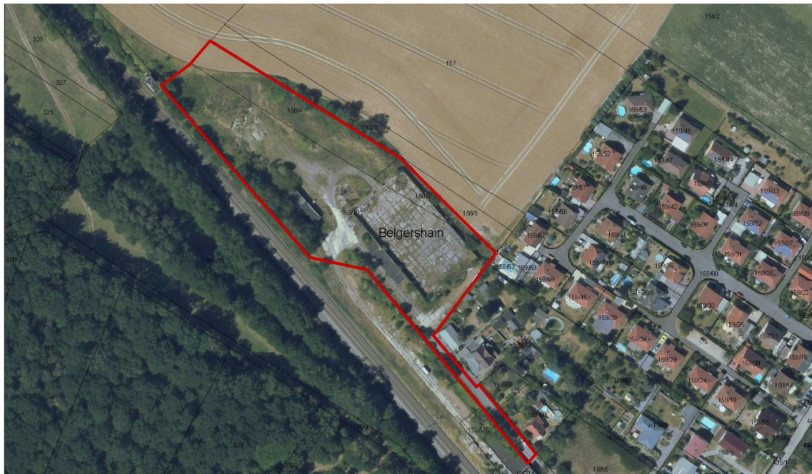
Abb.: Abgrenzung Plangebiet und Luftbild

Das Gelände wurde nach der Stilllegung als Recycling-Hof zwischengenutzt. Aus dieser Zeit stammen noch einige Haufwerke aus einem Gemisch aus Erdaushub und kunststoffhaltigen Shredder-Abfällen, die im nordwestlichen Grundstücksbereich lagern.